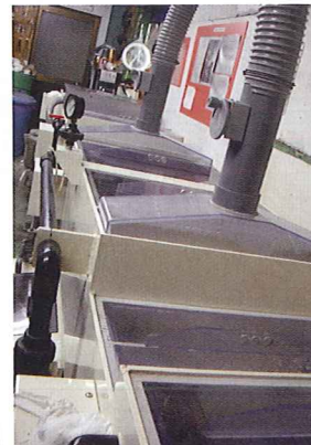
アルマイト印刷設備